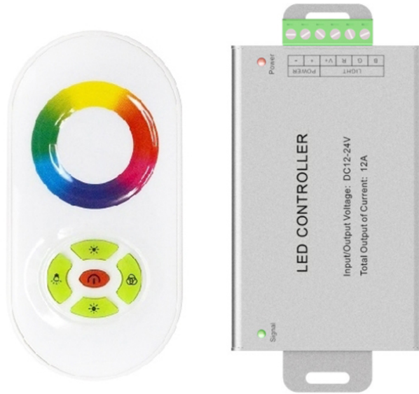
型号：AP-040RF 名称：半触摸 5 键铝壳 100cm